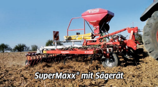
SuperMaxx® mit Sägerät