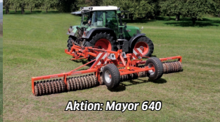
Aktion: Mayor 640